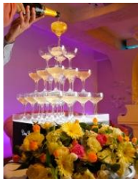
シャンパンタワー ¥10,000