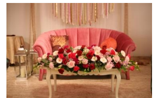
メイン装花+アレンジ ¥30,000~承ります☆