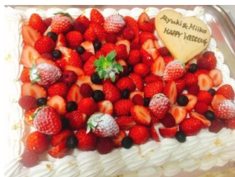
ウェディングケーキ ¥20,000~